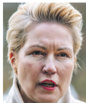
Manuela Schwesig (SPD)