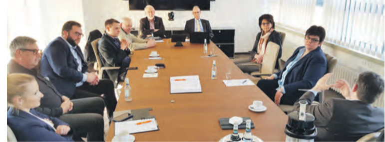
Interessante Gesprächsrunde bei der enwag