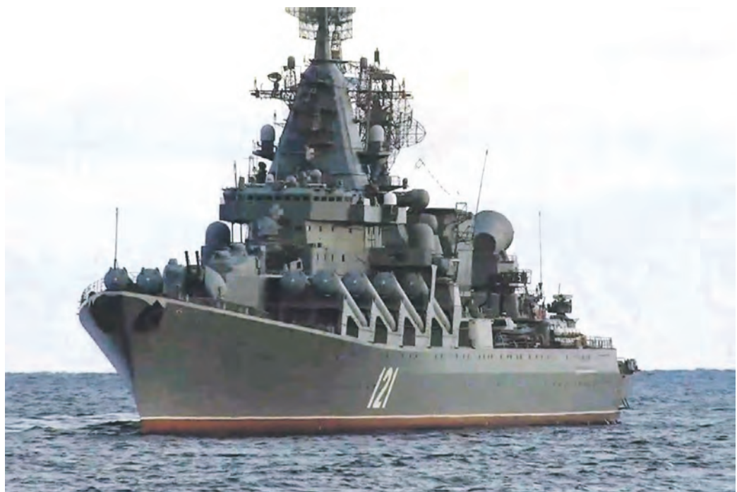
Die mit Marschflugkörpern ausgestattete „Moskwa“ gilt als der Stolz der russischen Schwarzmeerflotte. Sie ist mit modernsten Waffen ausgestattet

Das Flaggschiff der Schwarzmeerflotte, häufig von Putin besucht, hat 2008 bereits am Georgien-Krieg teilgenommen, 2014 bei der Krim, und es wirkte mit bei der Bombardierung Syriens in den Jahren 2015 und 2016. Die besondere Bedeutung, von der Psychologie einmal abgesehen, besteht darin, dass die Moskwa der Gesamtflotte die über Radar gewonnenen Informationen zur Verfügung stellen konnte. Diese Möglichkeit gibt es jetzt nicht mehr. Ein großartiger Erfolg für die ukrainischen Truppen.